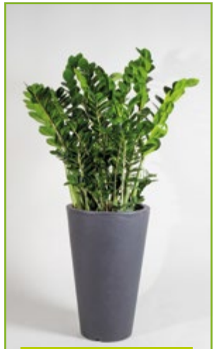
Zamioculcas in Vasengefäß 120 – 140 cm