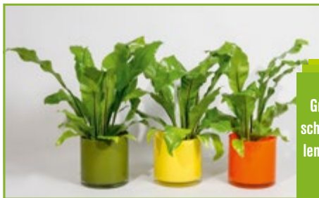
Grünpflanzen in ver- schiedenen Pflanzscha- len in diversen Farben und Größen