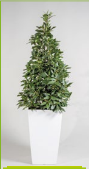
Lorbeerpyramide 160- 180cm