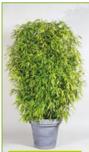
Bambus 160 – 220 cm

Unkomplizierte Abwicklung und kompetente Beratung vor Ort für eine ansprechende Dekoration.