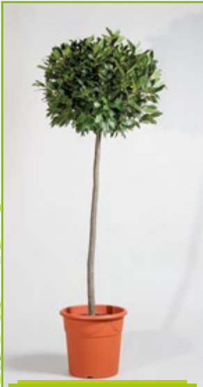
Lorbeerkugel 160 - 180cm