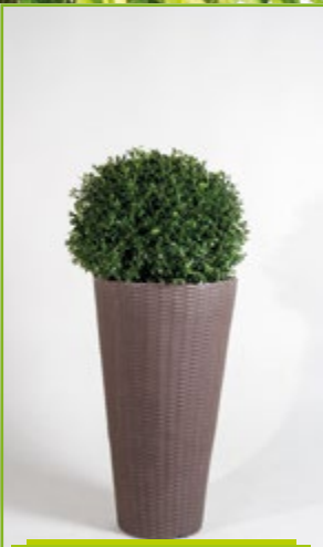
Buxkugel Dm 40 – 50 cm