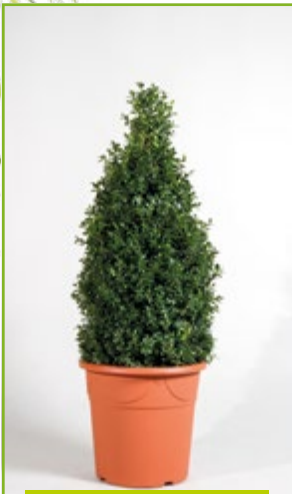
Buxpyramide 90 – 110 cm