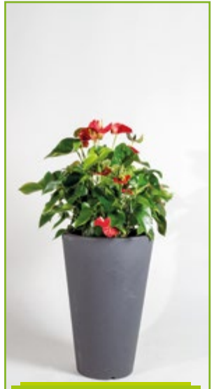
Anthurie in Vasengefäß 120 – 140 cm