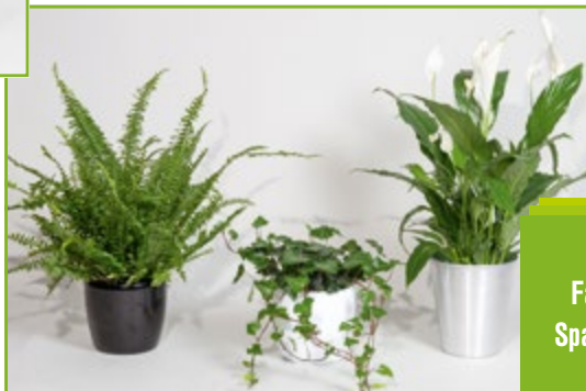
Farn, Efeu, Spathiphyllum

Die Leihpflanzen werden spätestens 2 Stunden nach Messeschluss abgeholt. Bei Events nach Vereinbarung. Bitte ermöglichen Sie unseren Mitarbeitern den ungehinderten Zutritt zu den Leihpflanzen. Wenn nachweislich angelieferte Ware (Lieferschein) abhanden kommt, haftet der Besteller mit dem vollen Kaufpreis.