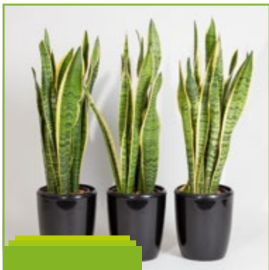
Keramikgefäß mit Sanseveria