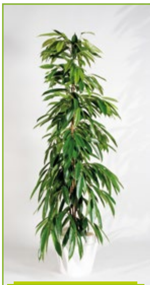
Ficus Amstel King 160 – 180 cm