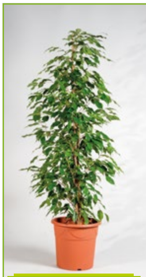
Ficus benjamini 100 – 200 cm