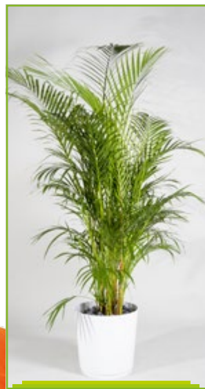
Areca 140 - 200cm